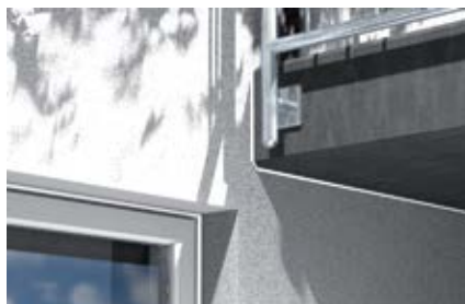
Наружные соединительные швы