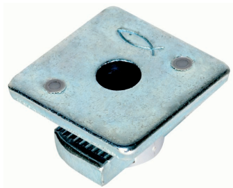
FCN Clix M