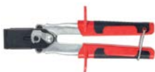
HM Z 1 – профессиональный монтажный инструмент