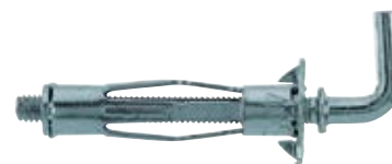
HM-H с крюком