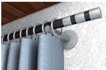
Карнизы для штор