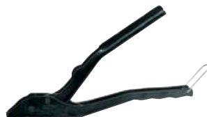
HM Z 2 – непрофессиональный монтажный инструмент