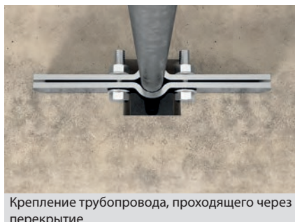
Крепление трубопровода, проходящего через перекрытие