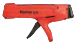
Выпрессовочный пистолет FIS DMS