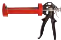
Выпрессовочный пистолет FIS AC