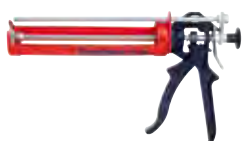
Выпрессовочный пистолет FIS AM