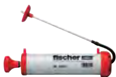
Продувочный насос ABG