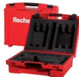
Термозащитный кейс, пустой