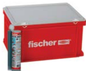
FIS VS 360 S HWK большой