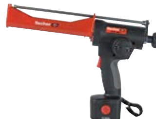
Аккумуляторный выпрессовочный пистолет FIS DC 4000 S