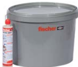
FIS VS 300 T в контейнере