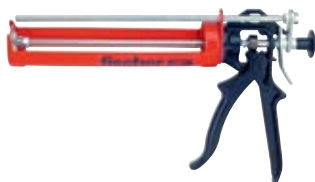
Выпрессовочный пистолет FIS AM