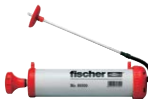
Продувочный насос ABG