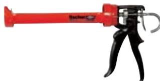
Выпрессовочный пистолет KPM 2