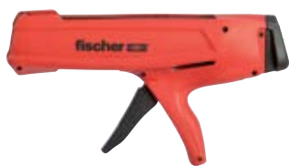
Выпрессовочный пистолет FIS DM S