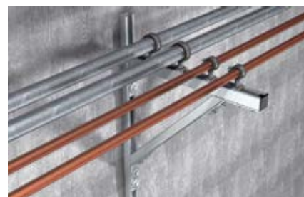
Легкие консольные конструкции